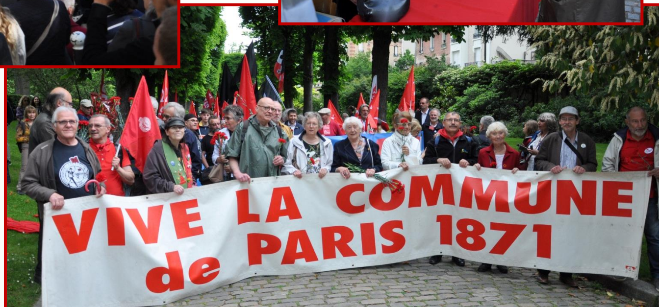
La montée au Mur des Fédérés (2019)