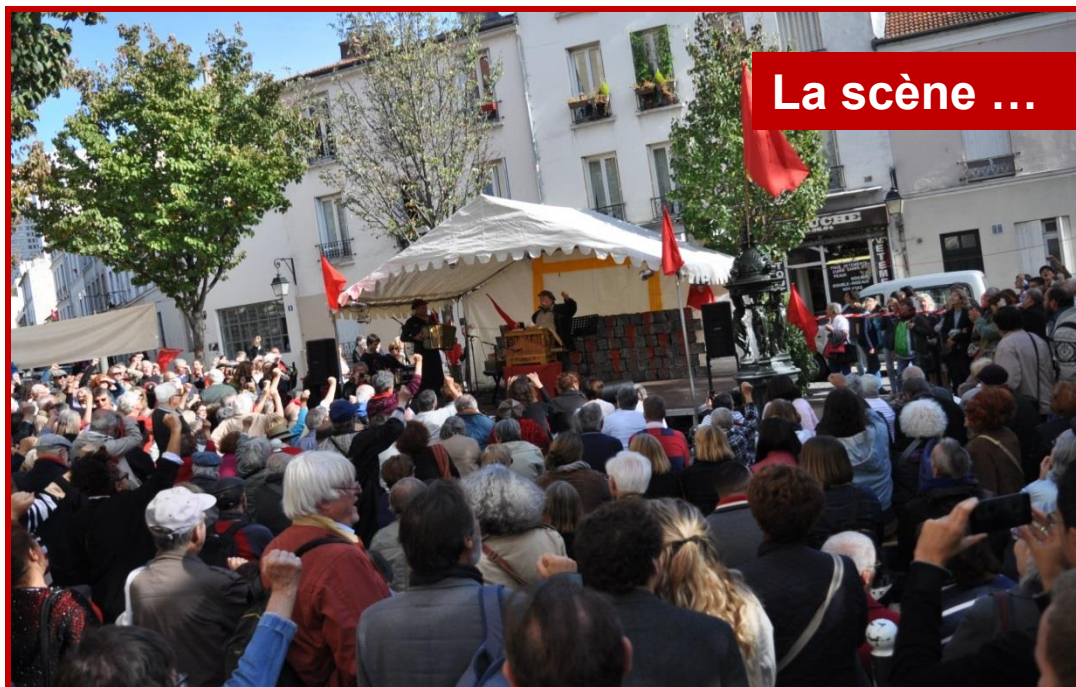
La scène ...