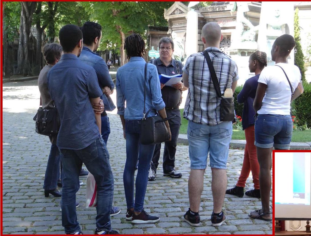
Parcours communards ...