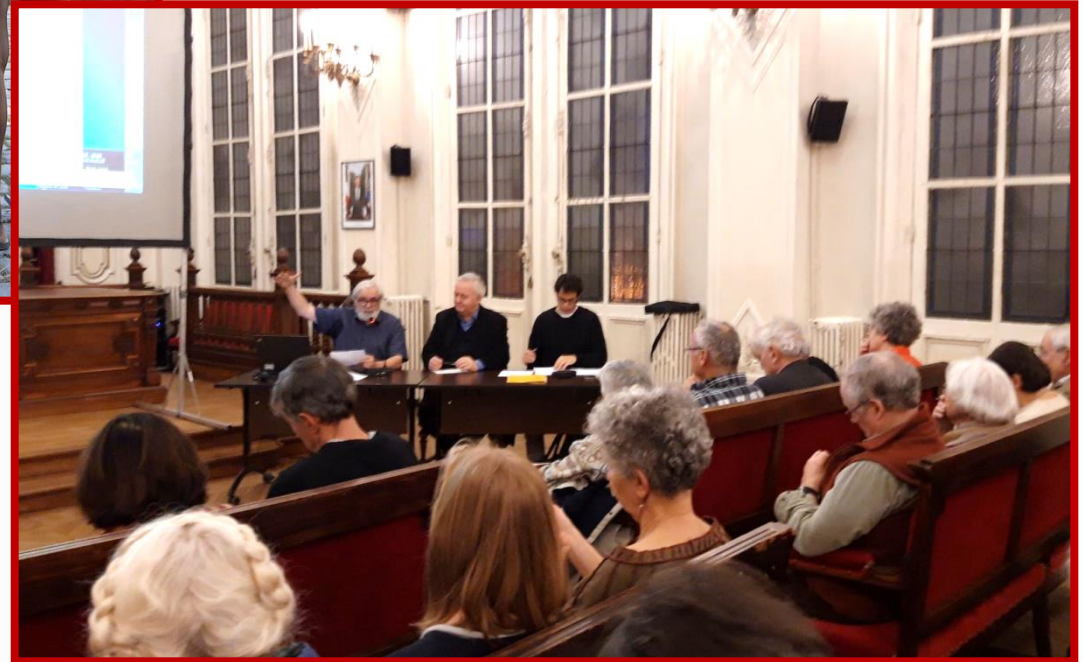
... Soirées de l'histoire (2018)