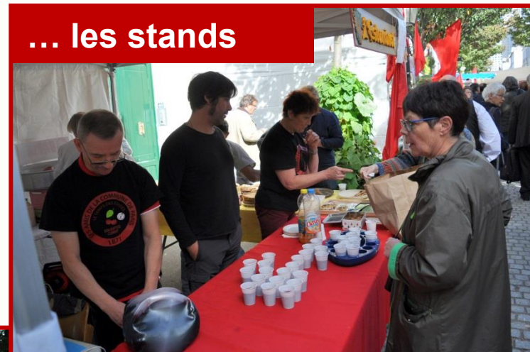
... les stands